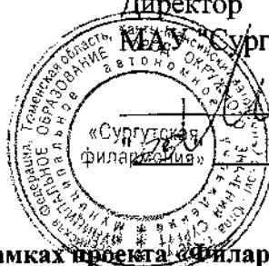
График проведения филармонических уроков в рамках проекта «Филармония для школьников». Муниципальное бюджетное общеобразовательное учреждение средняя общеобразовательная школа №7